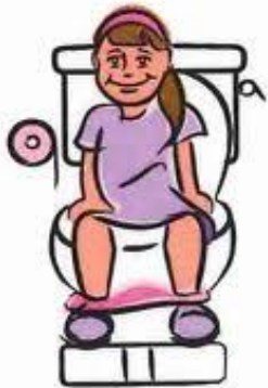
sit on the toilet